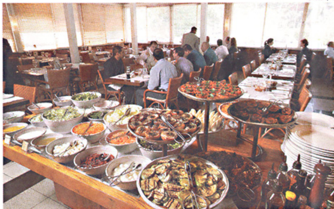
SALÃO PRINCIPAL - A mesa de saladas, ao centro, recebeu outras peças de cerâmica, próprias de bufê

Como mudança mais visível no ambiente, vale citar a ampliação da área do bar, que teve o balcão estendido. A área externa ganhou um deque de madeira ao redor de uma fonte. O bar tem agora capacidade para 35